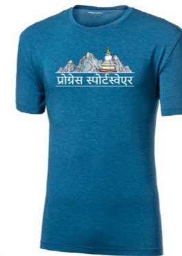
AROMATIC „NEPAL“ pánské triko s kávovou viskózou

materiál: 40% akryl + 37% viskóza (Cocarber®) + 18% polyester + 5% Elastan