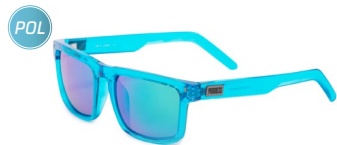
ECLIPSE GRN-R T-BLU sluneční brýle s polarizačními skly

Představujeme vám kolekci opravdu funkčních slunečních brýlí pro sportovní i volnočasové aktivity. Díky vysoce kvalitním materiálům a ergonomickému designu jsou vhodné zejména pro cyklistiku, běh, běžky i turistiku. A kromě spolehlivé ochrany před slunečním zářením a UV paprsky disponují mnoha vychytanými technickými detaily. Naše atestované modely brýlí filtrují okolní svět a zobrazují jej v těch správných barvách a zároveň 100% chrání váš zrak.