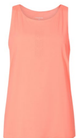
TECHNICA SINGLET dámské sportovní tílko