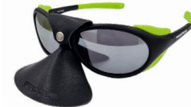
VERTICAL MRR BLK-GRN horolezecké sluneční brýle