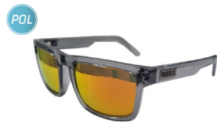
ECLIPSE ORG-R T-GRY sluneční brýle s polarizačními skly