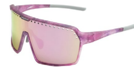
ENDURO PNK-R PUR/GRY sportovní sluneční brýle