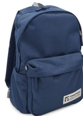
LAX batoh pro každodenní nošení