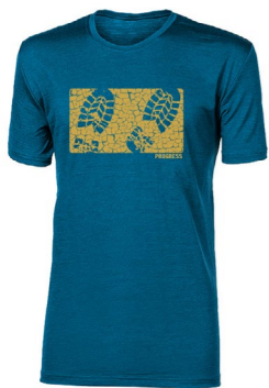
HRUTUR „STEP“ pánské merino triko