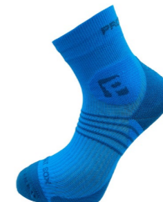
SUPPORT SOX běžecké ponožky