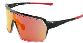
ENDURO RED-R BLK/RED sportovní sluneční brýle