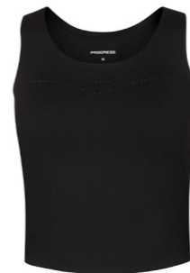
ZORA TANKT TOP dámský sportovní top