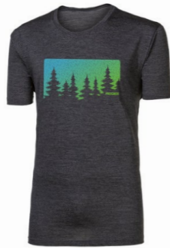
HRUTUR „FOREST“ pánské merino triko