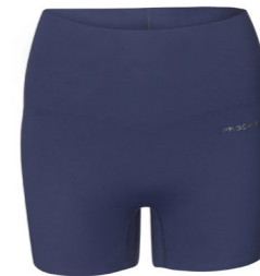
ZORA MINI SHORTS dámské sportovní šortky