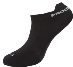
LOWLY BAMBOO nízké letní ponožky s bambusem

Pohodlí, které začíná u nohou, nemá konce. Máme ponožky pro všechny sportovní, cestovatelské, společenské a volnočasové příležitosti. Stačí si jen vybrat!