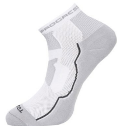
TOURIST letní turistické ponožky