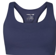
ZORA BRA dámská sportovní podprsenka