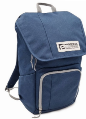
CIVIC batoh pro každodenní nošení