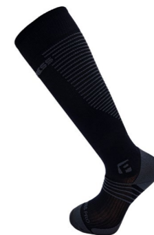
COMPRESS PRO kompresní podkolenky