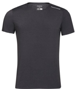
TECHNIC pánské sportovní triko