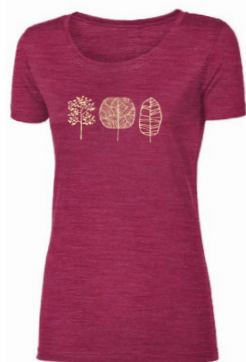
VINKA „TREES“ dámské merino triko