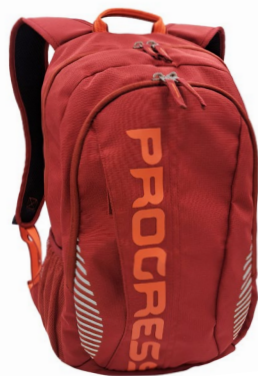
DAYPACK 25 turistický batoh *

Vyberte si správný batoh, který vám sedne nejen na záda, ale hlavně bude vyhovovat vašim cestovatelským potřebám. A asi nemusíme dodávat, že jde o prvotřídně zpracované kusy se spoustou technických vychytávek, které vás chytanou a nepustí. Na výběr máte několik praktických velikostí.