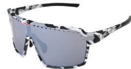
ENDURO MRR BLK/WHT sportovní sluneční brýle