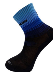
VEREDA SOX outdoorové ponožky