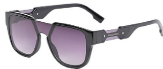
ERROR SMK BLK sluneční brýle