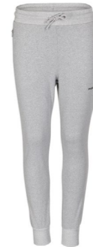
SYMBOL PANTS JUNIOR