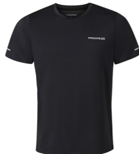
PREDATOR pánské sportovní triko