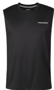
DRIVER SINGLET pánský sportovní nátělník

Technologie lepených švů umožňuje spojení dvou částí materiálu bez použití jakýchkoli nití, které by mohly při sportování způsobit podráždění pokožky a proto poskytuje při nošení maximální pocit pohodlí. Švy jsou mnohem pružnější a zajišťují vyšší komfort.