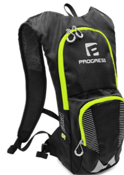
BIKER 5 cyklobatoh *