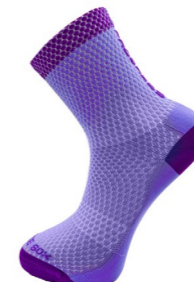
AIR LITE SOX běžecké vysoké ponožky