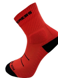
OFFROAD SOX cyklistické ponožky