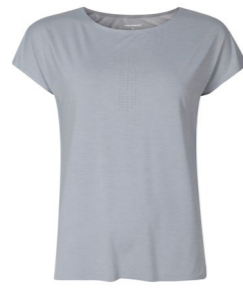
TECHNICA dámské sportovní triko