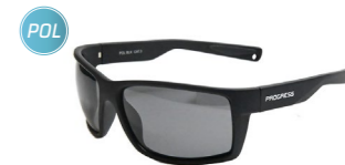
LOOKER POL BLK brýle s polarizačními skly