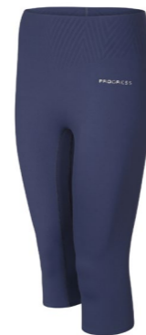
ZORA 3Q dámské 3/4 legíny