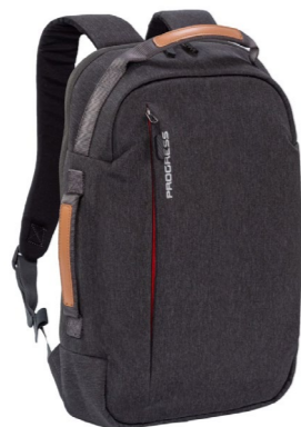
MANAGER městský batoh na notebook

nastavitelné ramenní, hrudní a bederní popruhy