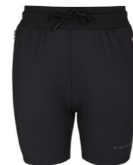
SYMBOL SHORTS JUNIOR