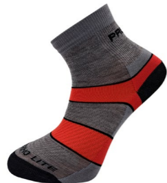
TRAIL MERINO LITE outdoorové ponožky