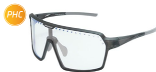
ENDURO PHC-BLU BLK sportovní fotochromatické brýle