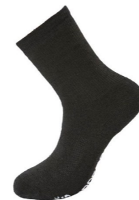
MANAGER MERINO ponožky s merino vlnou