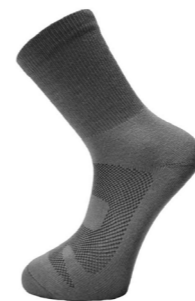
MANAGER BAMBOO ponožky s bambusem