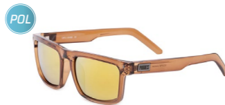
ECLIPSE GLD-R T-BRW sluneční brýle s polarizačními skly