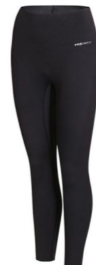
ZORA dámské dlouhé legíny