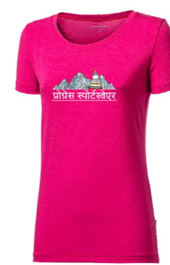
AROMA „NEPAL“ dámské triko s kávovou viskózou