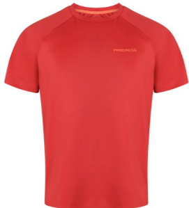
DRIVER pánské sportovní triko