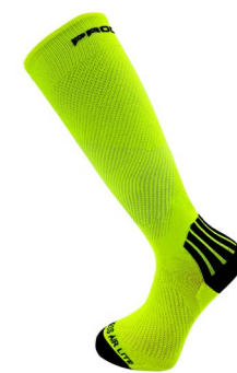
COMPRESS AIR LITE odlehčené kompresní podkolenky