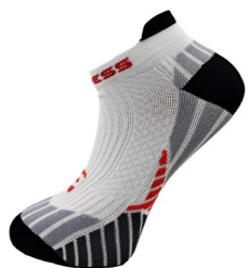
SNAKER SPORT SOX běžecké ponožky