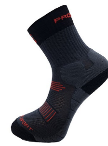
INDOOR SPORT sportovní ponožky