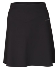
ZORA SKIRT dámská sportovní sukně