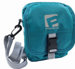
CROSS BODY kapsička přes rameno *