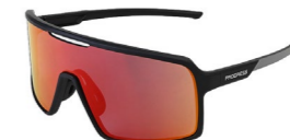
VISION RED-R BLK/GRY sportovní sluneční brýle