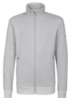
SYMBOL JKT JUNIOR