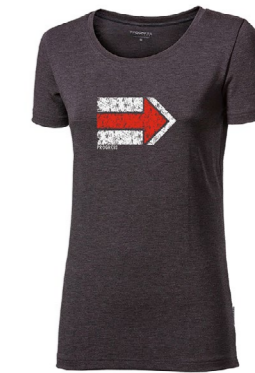
AROMA „KCT“ dámské triko s kávovou viskózou